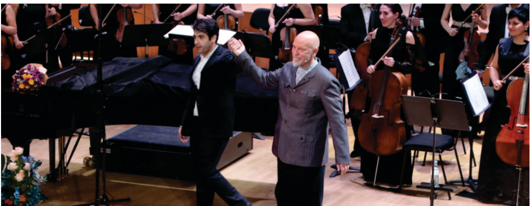
ՋՈՆ ՄԱԼԿՈՎԻՉ | JOHN MALKOVICH

2021թ. անցկացվող Խաչատրյանի անվան միջազգային 9-րդ փառատոնը կրում է «Երեք ընկեր. Խաչատրյան, Պրոկոֆև, Շոստակովիչ» խորագիրը՝ նշանավորելով 20-րդ դարի երեք խոշոր կոմպոզիտորների ստեղծագործական մտերմությունը: