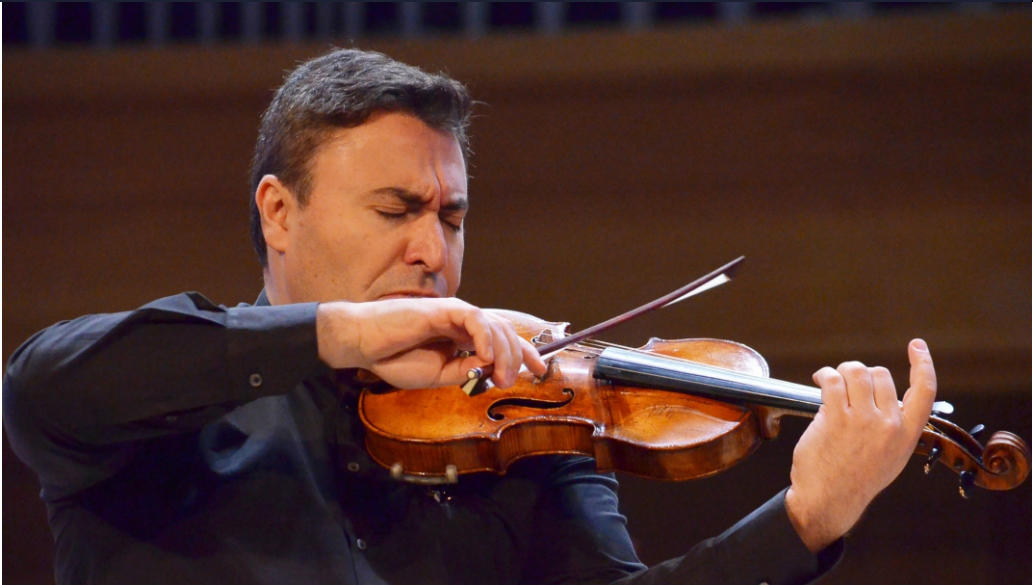
ՄԱՔՍԻՄ ՎԵՆՂԵՐՈՎ | MAXIM VENGEROV

Խաչատրյանի անվան միջազգային փառատոնը տարածաշրջանում դասական երաժշտության լայնորեն ճանաչելի քաթիվ փառատոններից է, որի հեղինակությունն ու մասնակիցների աշխարհագրությունը տարեցտարի ընդլայնվում են: 2013թ. Հայաստանի պետական սիմֆոնիկ նվագախմբի և գեղարվեստական ղեկավար ու գլխավոր դիրիժոր Սերգեյ Սմբատյանի ջանքերով հիմնադրված փառատոնը ամեն տարի մայրաքաղաք Երևանում հյուրընկալում է համաշխարհային մեծության սիրված արտիստների, որոնք երաժշտության լեզվով ստեղծում են միջմշակութային երկխոսության մթնոլորտ, ինչպես նաև իրենց կատարումներով ընդլայնում Արամ Խաչատրյանի երաժշտության ճանաչումը: Ամենամյա փառատոնի պատմության մեջ Ջոն Մալկովիչը, Չախար Բրոնը, Մաքսիմ Վենգերովը, Սերգեյ Խաչատրյանը, Մայու Քիշիման, Նինգ Ֆանգը, Բորիս Բերեզովսկին, Գլորիա Զամփաները, Ալեքսանդր Ռոմանովսկին, Նարեկ Հախնազարյանը և շատ ուրիշներ դարձել են Խաչատրյանական երաժշտական տիեզերքի վառ աստղերից: